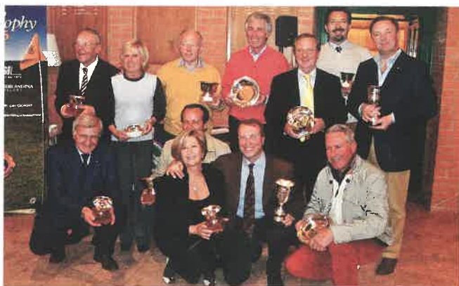
Gruppo dei premiati al Cosmopolitan