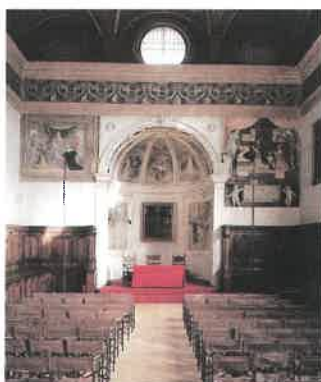
La splendida sagrestia vuota prima dell'arrivo dei 200 ospiti

PRESENTAZIONE TROPHY - MILANO 22.02.2005