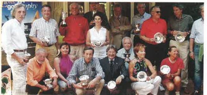
I premiati a Garlenda