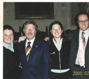
Il "CLAN" Spaini alla Segreteria. Il Presidente con le nipoti ed il figlio