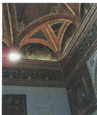
Un'immagine dello splendido soffitto affrescato da Leonardo Da Vinci

sissime gare golfistiche con lo scopo non solo di rinsaldare i vincoli d'amicizia tra i soci ma anche con quello, non meno importante, di raccogliere fondi per i services lionistici.