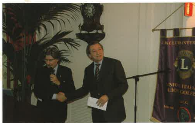
Amministratore "Pane quotidiano", Milano