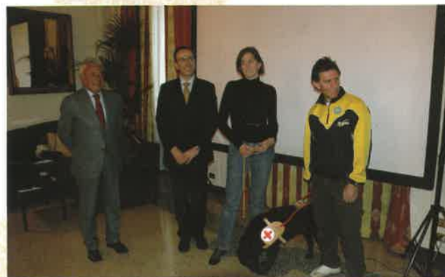
La consegna del cane alla signora non vedente