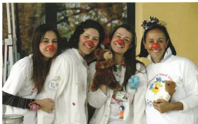
Gruppo VIP (Vivere in Positivo)