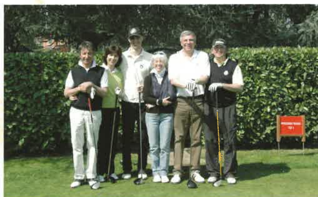
La squadra UILG che si è classificata 1° Lordo