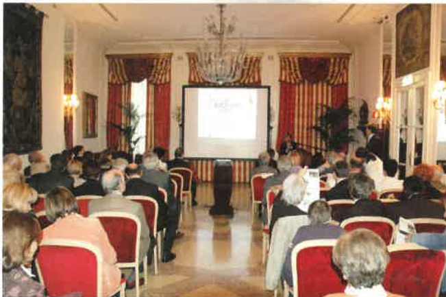
Grand Hotel et de Milan presentazione Trophy 2008

L'Unione si è da tempo dotata di un foglio notizie