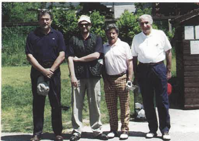
Il team del Presidente.