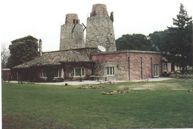
Le vecchie ciminiere che contraddistinguono la club-house di Perugia