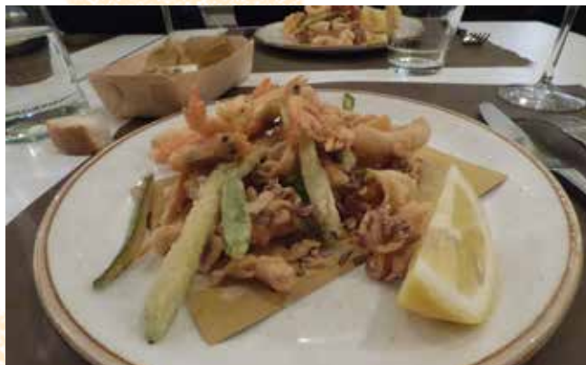
Cena sociale, il fritto misto della Versilia.