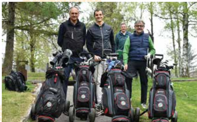
Team tutto con sacche UILG.