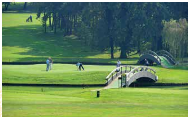
Golf Club Castelconturbia, sede del 30° Campionato Italiano UILG.

Insieme con il sorriso per un golf di solidarietà.