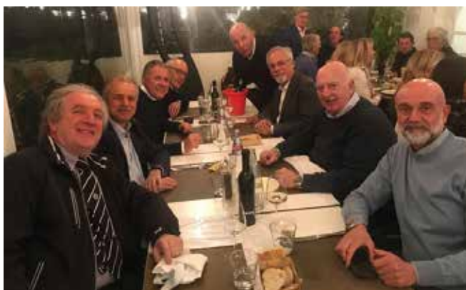
Cena sociale, Solo uomini Lombardia.