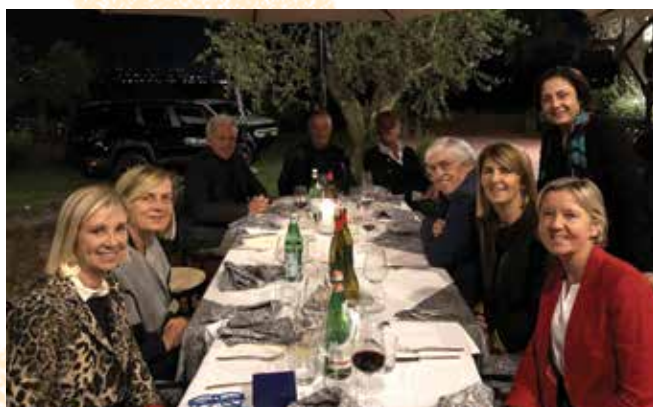
Parterre femminile alla cena.