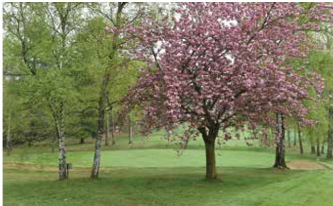
Green buca nove.