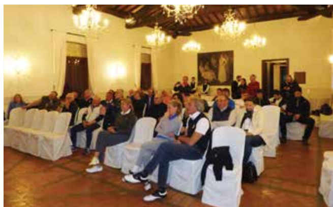
La bella sala della premiazione.