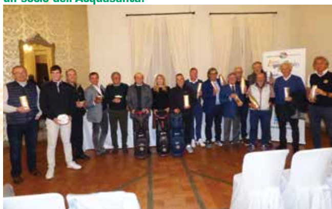
Il gruppo dei premiati.