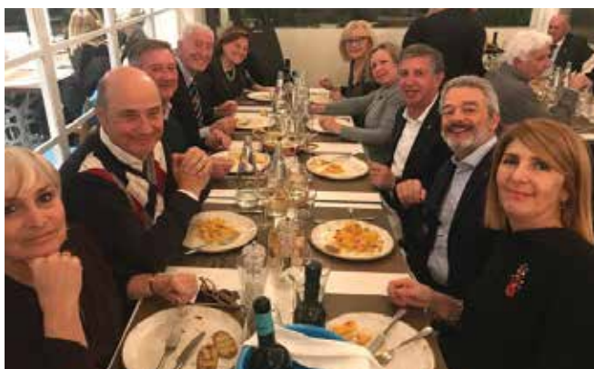
Cena sociale gruppo misto, Prato, Veneto, Lombardia.