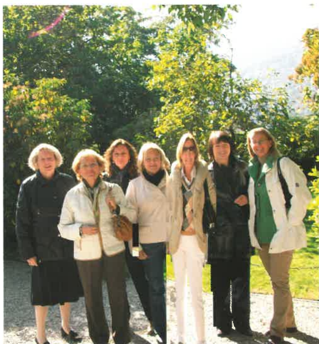
Le Signore ai Giardini di Palazzo Borromeo