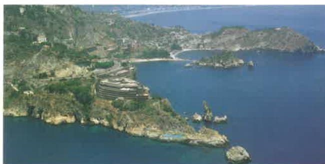
L'hotel Capotaormina a picco sui due golfi

Prolungamento euro 135,00 al giorno per persona in ½ pensione in camera doppia. Compilate senza impegno la scheda di gradimento in modo che la UILG possa verificare il numero di adesioni e procedere al blocco delle camere.