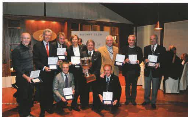
La squadra Lions Uilg vincente