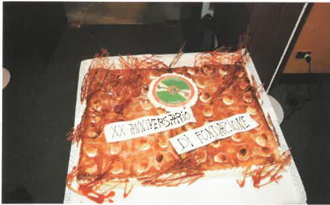
La torta del XX° anniversario