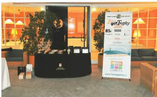
Il tavolo della premiazione