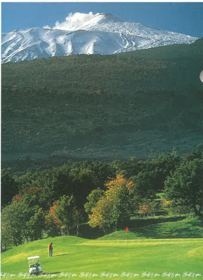
Golf Club Il Picciolo sulle pendici dell'Etna