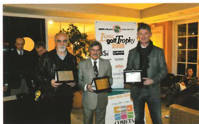
I vincitori del titolo del distretto (108-IA1)