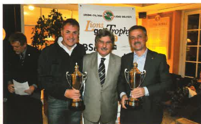
I due campioni italiani 2010