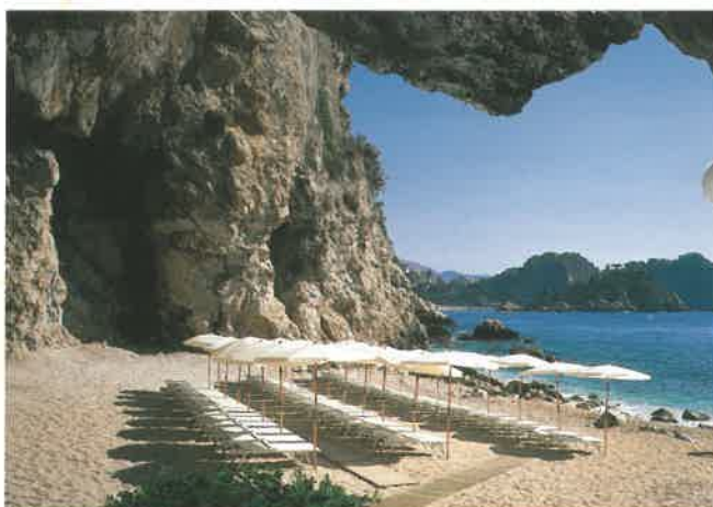
Una delle spiagge dell'hotel