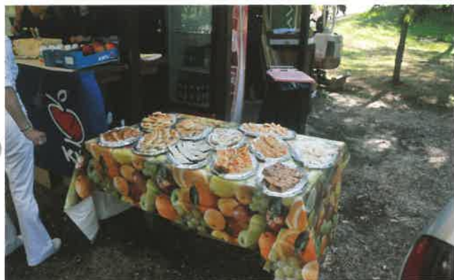
La favolosa bouvette "Famiglia Pirone"