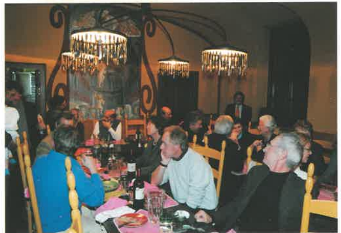
Visita in Cometa Dicembre 2008