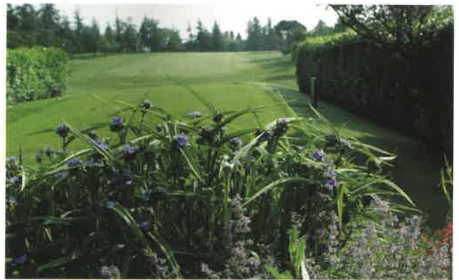
Una buca fiorita