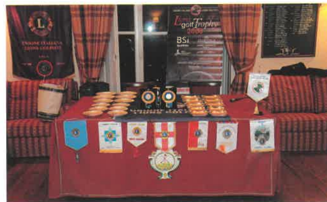
Il tavolo della premiazione con i guidoncini dei lions club locali