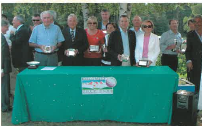
Il gruppo dei premiati