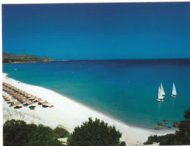
La spiaggia di sabbia bianca

Compilete senza impegno la scheda di gradimento in modo che la UILG possa verificare il numero di adesioni e procedere al blocco delle camere. Agli interessati sarà spedita conferma e modalità di prenotazione, in modo che possano prenotare i trasferimenti con anticipo ed alle migliori condizioni.