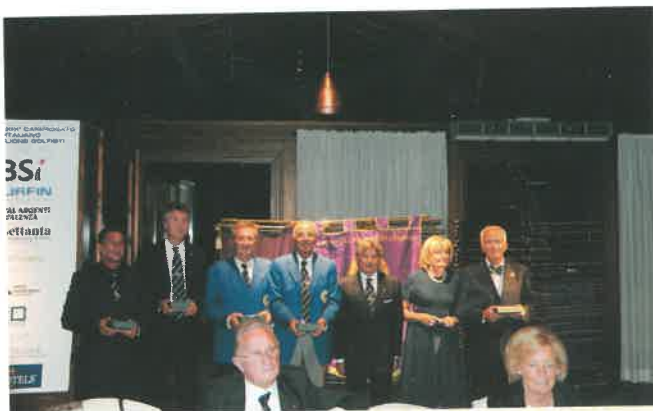
Il premio più meritato: i 100% presenze a tutte le gare