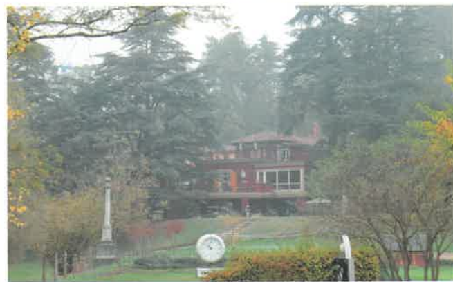
La club house di Villa Carolina