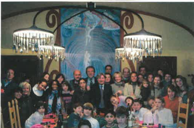
La visita della UILG in Cometa prima di Natale

L'anno trascorso è stato positivo per la UILG: il numero dei soci non è diminuito e in questi ultimi 4 anni è sempre