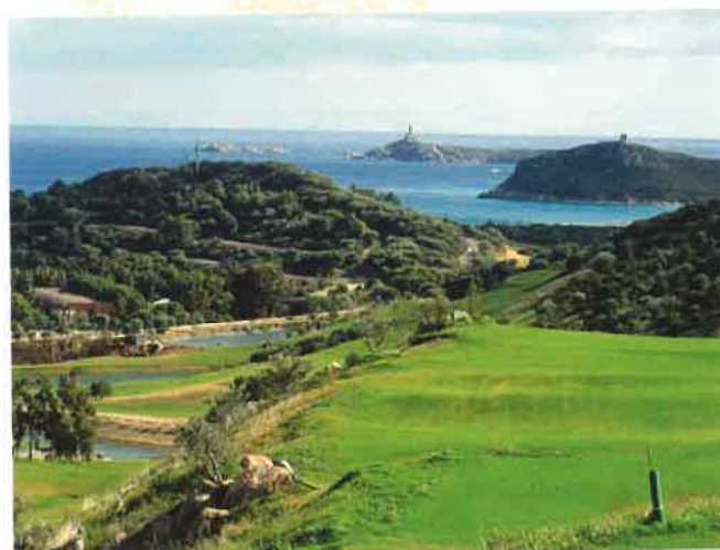
Il golf tra cielo e mare