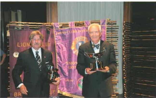
Secondo classificato nel Trophy Pier Felice Cignoli