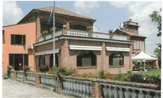
Club House di Margara