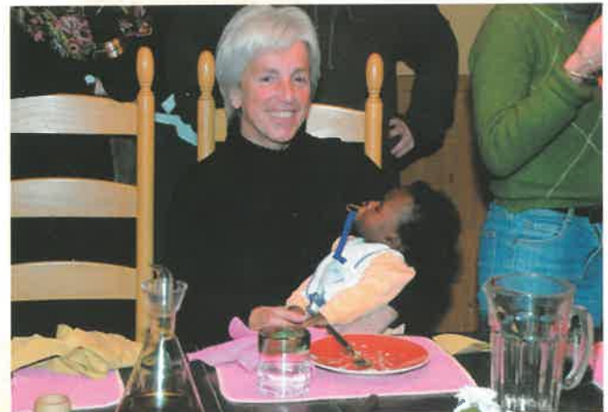
La UILG in Cometa