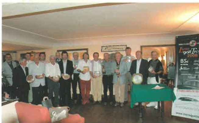
Il gruppo dei premiati