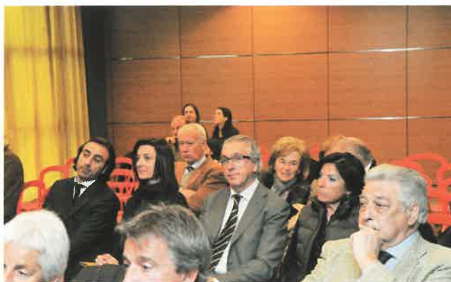
Una parte della sala