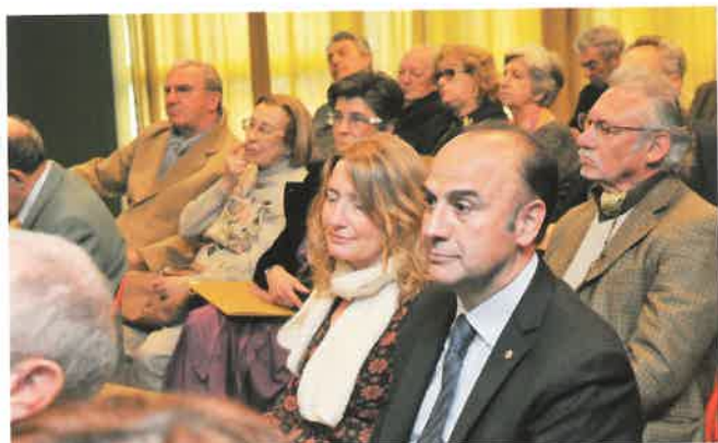
Un'altra veduta della sala