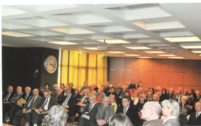
La sala gremita