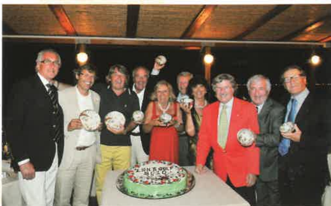
Il gruppo dei premiati