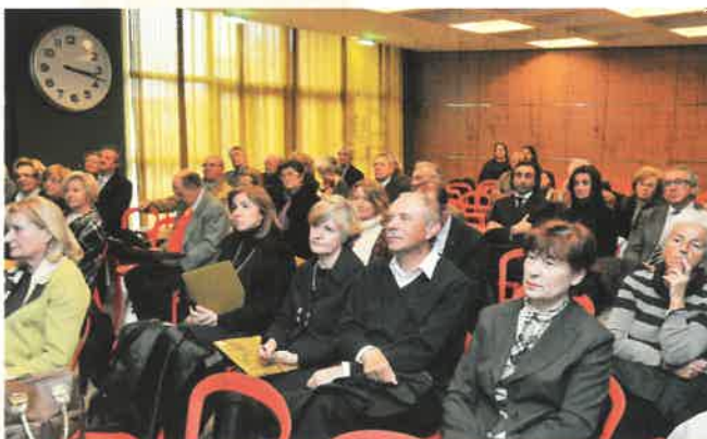
La sala gremita ed attenta