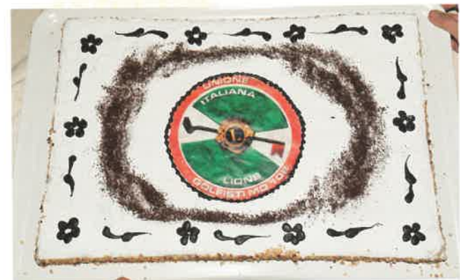
La splendida torta UILG preparata dal gestore Luca Rocchi