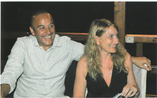
I cogniugi Gallo