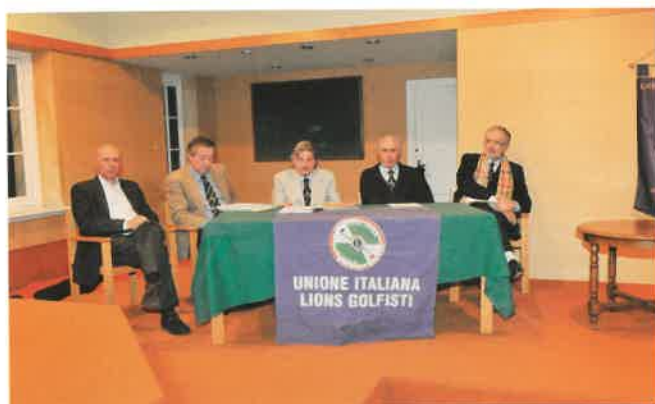
Il tavolo dei relatori nell'assemblea annuale

Il Presidente e il segretario dell'assemblea San Remo, 22 gennaio 2010.