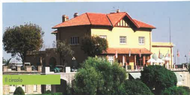
Golf Club San Remo