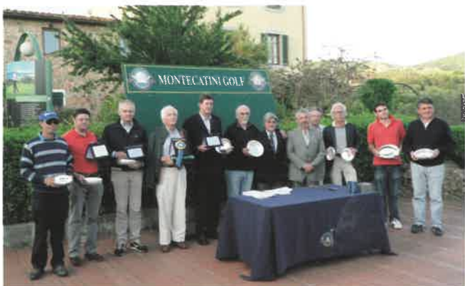
Il gruppo dei premiati