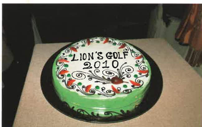
L'enorme cassata siciliana fatta in onore della UILG