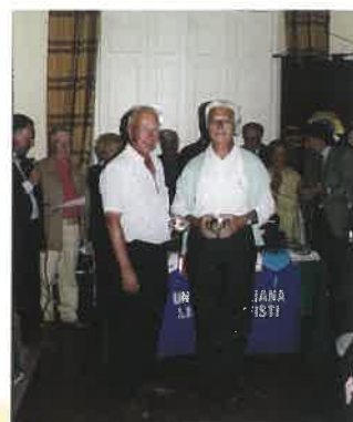
Terzi classificati Lions Maggi - Maura

Alla Villa si accede lasciando la strada statale, imboccando quindi un imponente viale ai cui lati i platani secolari attirano per la bellezza chi qui non è mai stato, e sono di preciso riferimento a coloro che, rivedendoli da lontano, si rendono conto di essere ormai giunti a destinazione.