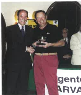
Primo netto 1 a cat. Marco Garfagnini