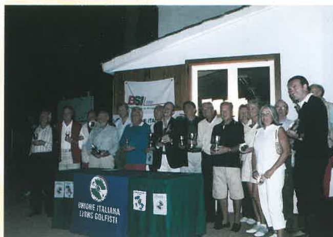
Il gruppo dei premiati

RINNOVARE SUBITO L'ASSOCIAZIONE VUOL DIRE CONFERMARE L'ABBONAMENTO GRATUITO A GOLF&TURISMO CON L'IMPERDIBILE GUIDA DEL GOLF