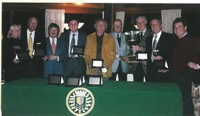
La squadra Lions vincitrice 2004