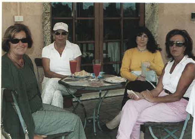
Relax dopo la faticata romana

La giornata è stata splendida con un clima ancora caldo ma leggermente ventilato: una classica ottobre romana