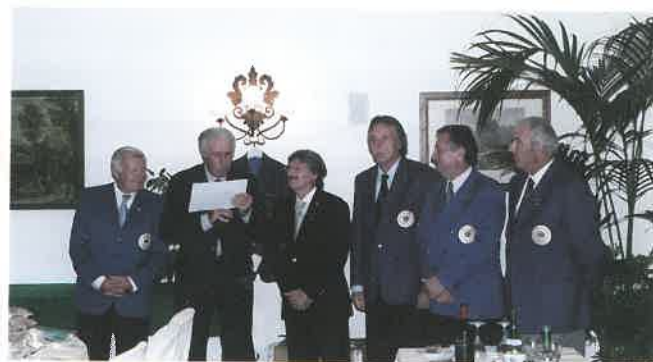
Le "giacche blu" in attesa del nuovo vincitore del Trophy 2004