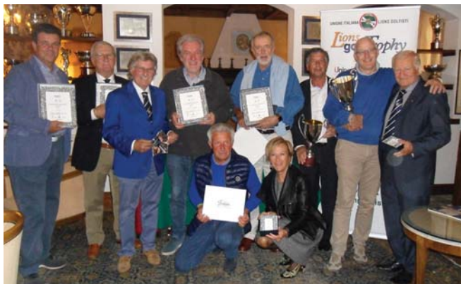
Il gruppo dei premiati.