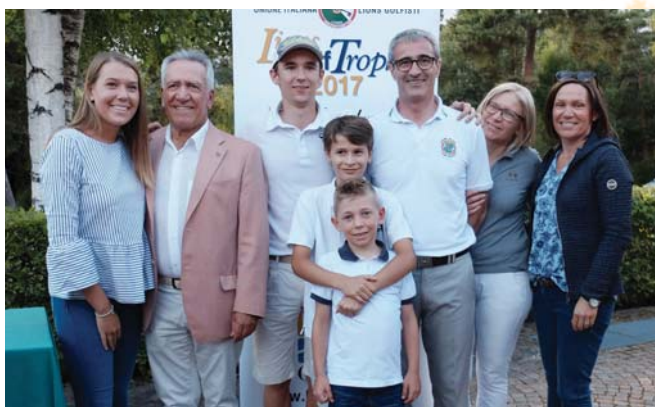
La famiglia Pirone al completo.