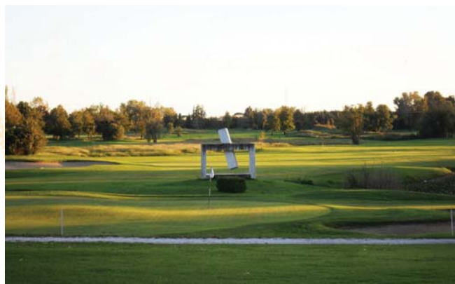
Il percorso di Forte dei Marmi al tramonto.

Molte sono le difficoltà anche sulle altre buche: alla buca 5, par 3 un ruscello invisibile attira le palline; alla 6 par 5, dog- leg a destra, molto accentuato con