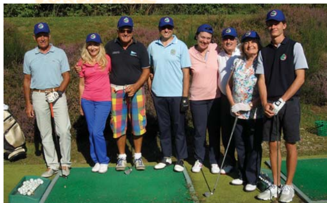
Gruppo Golf Clinic con presidente UILG.