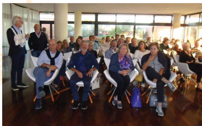
La club house in attesa della premiazione.