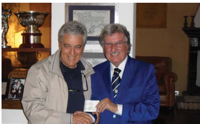
Il responsabile della Cooperativa Sociale Lions "Casa di Anna".