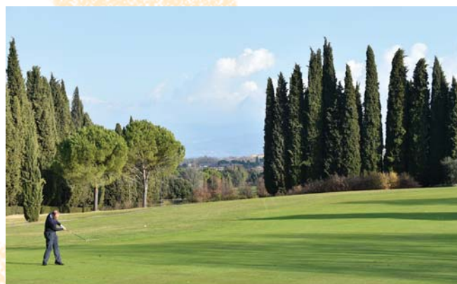
Il panorama del Garda Golf.

Indimenticabile la buca 2 del percorso giallo: una sfida per i più bravi, un azzardo per i più fortunati. Il clima non ancora invernale, il verde smeraldo dei fairway, l'occhieggiare delle rose ancora fiorite, l'allegria dei compagni ha reso la giornata godibilissima per tutti. Al tramonto, verso le 16,30, tutti in clubhouse per una