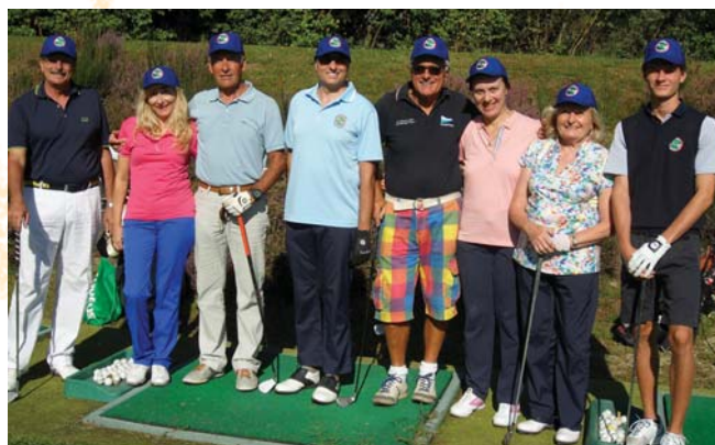
Gruppo della Golf Clinic con il maestro.