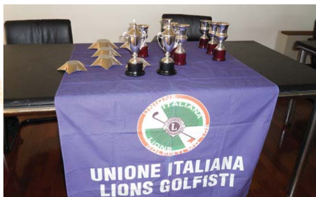
Le luccicanti coppe ARVAL.