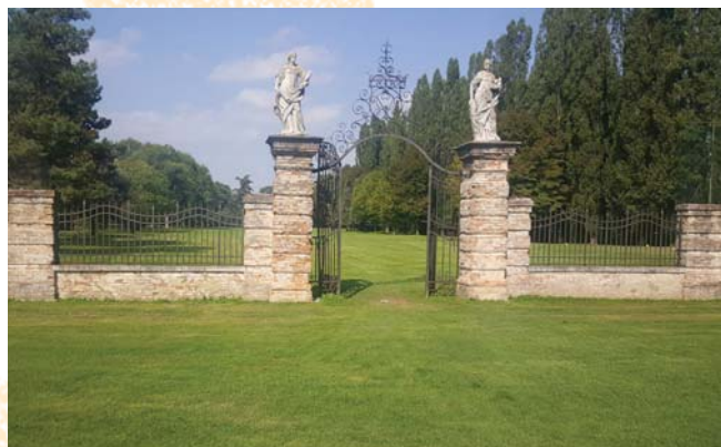
La buca 2 con il simbolo di Villa Condulmer, i resti della cancellata.