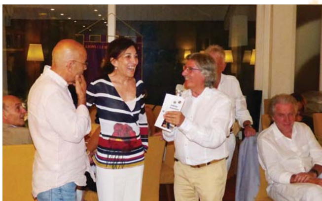
I rappresentanti de "Il pane quotidiano" di Milano.