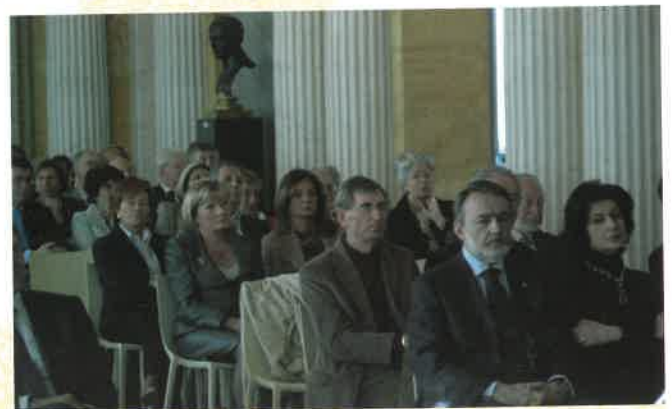
Un gruppo di soci UILG a Villa Reale