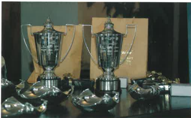
Le nuove splendide coppe ARVAL per il Trophy 2007

Il Presidente apre la seduta ringraziando i presenti per l'interessata partecipazione e precisando che possono partecipare all'assemblea annuale i Soci in regola con le quote sociali che possono altresì essere portatori di un massimo di due deleghe.