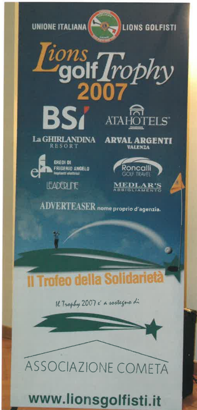
Il nuovo totem del Lions Golf Trophy 2007