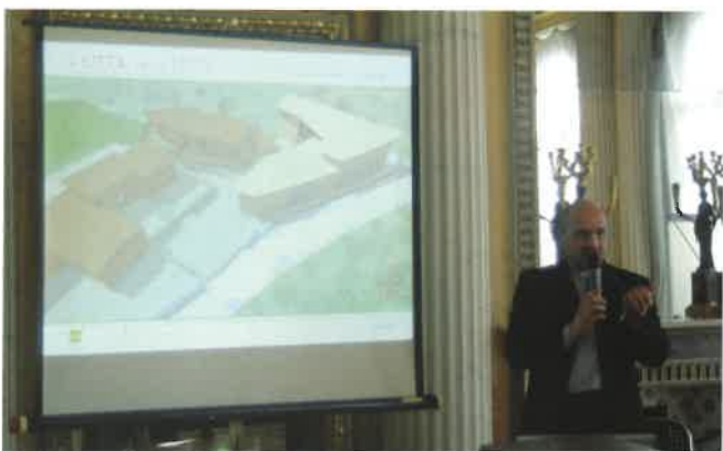
Erasmus Figini presenta il nuovo progetto "La città nella città"